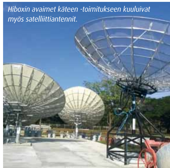
Hiboxin avaimet käteen -toimitukseen kuuluivat myös satelliittiantennit.